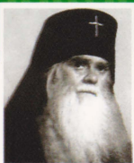
Архиепископ Аверкий (Таушев)