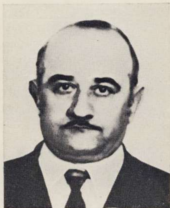
Карелин Кирилл Феоктистович