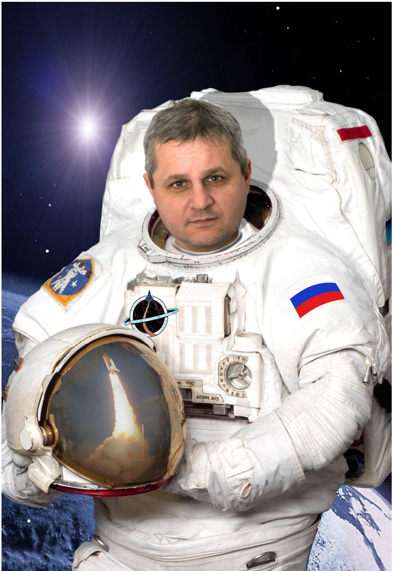
L una * O leg * V ladimirovich * E rmakov